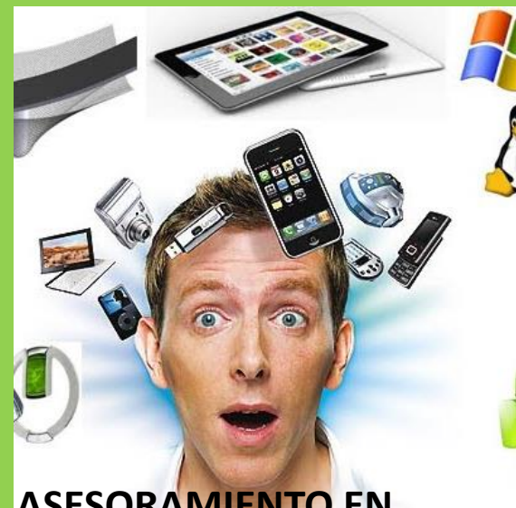
ASESORAMIENTO EN TECNOLOGÍA Y PRODUCTOS DE APOYO