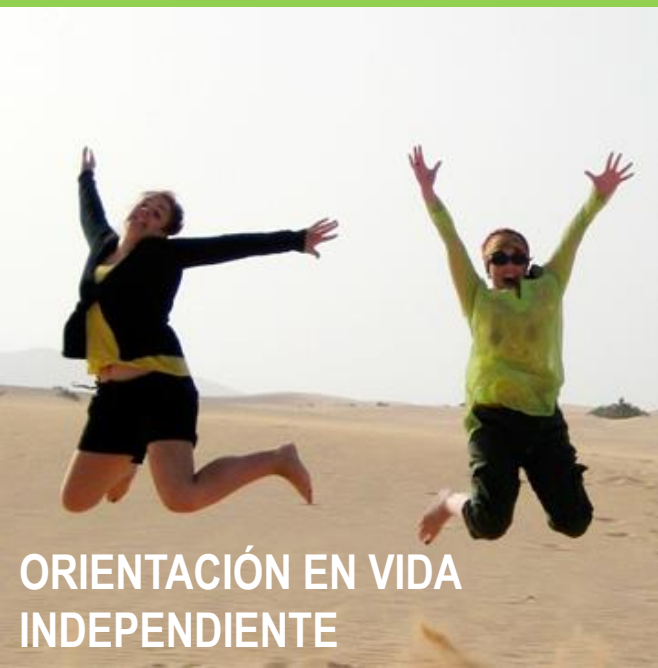
ORIENTACIÓN EN VIDA INDEPENDIENTE